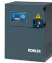
Verso 200 en Coffret IP20